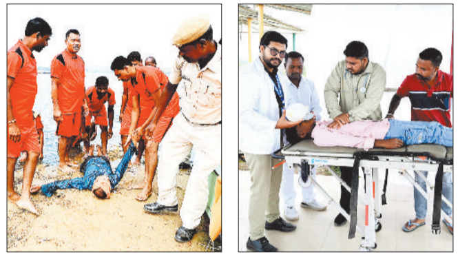
झुमका जलाशय में की जा रही मॉकड्रिल।

ने बाढ़ के तेज बहाव में फंसे ग्रामीणों को निकालने की प्रक्रिया को समझाया। पोर्टलों को सुरक्षित बाहर निकालकर फायर कर्मियों द्वारा एम्बुलेंस से स्वास्थ्य टीम तक पहुंचाया गया। मौके पर मौजूद