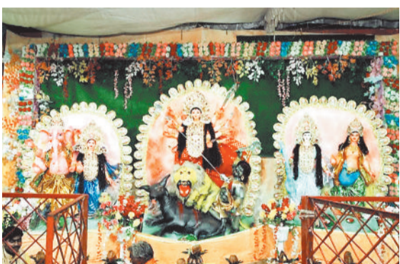
सोनहत के कछर में विराजी मां दुर्गा।