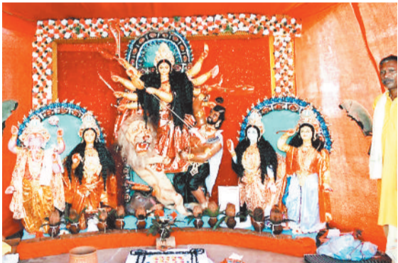
सोनहत रजौली में विराजी मां दुर्गा।