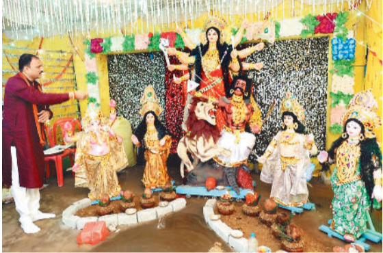
मनेन्द्रगढ़ के ग्राम बेलबहरा में विराजी मां दुर्गा।