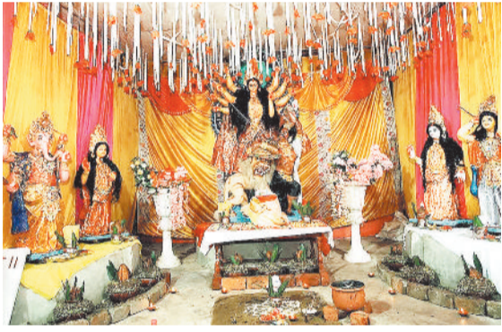
सोनहत बेलिया में विराजी मां दुर्गा।