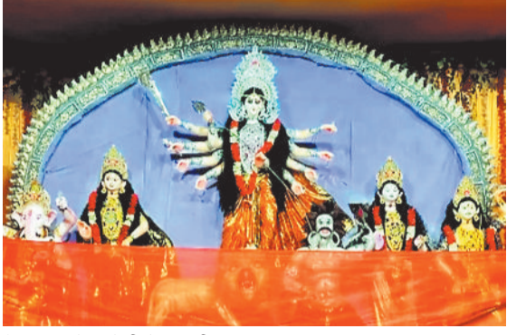
बैकुण्ठपुर के कुड़ेली में विराजी मां दुर्गा।