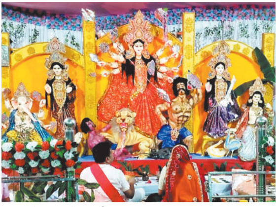
आदर्श चौक पटना में विराजी मां दुर्गा